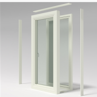
Dubbelkarm utsida Dubbelkarm utsida