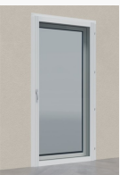
Dubbelkarm insida Dubbelkarm insida